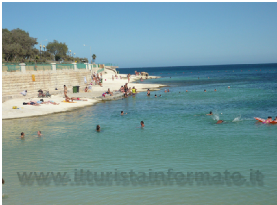
St. Thomas Bay