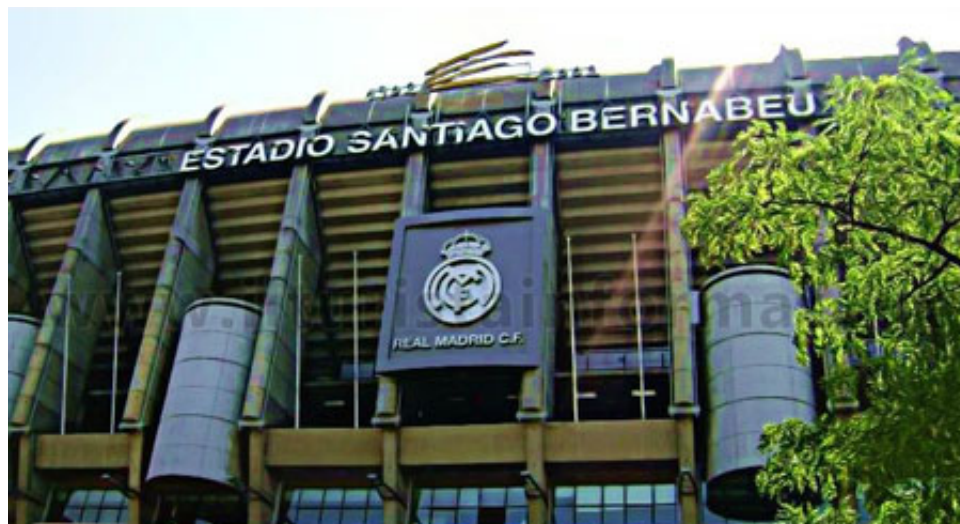
Lo Stadio “Santiago Bernabeu” di Madrid