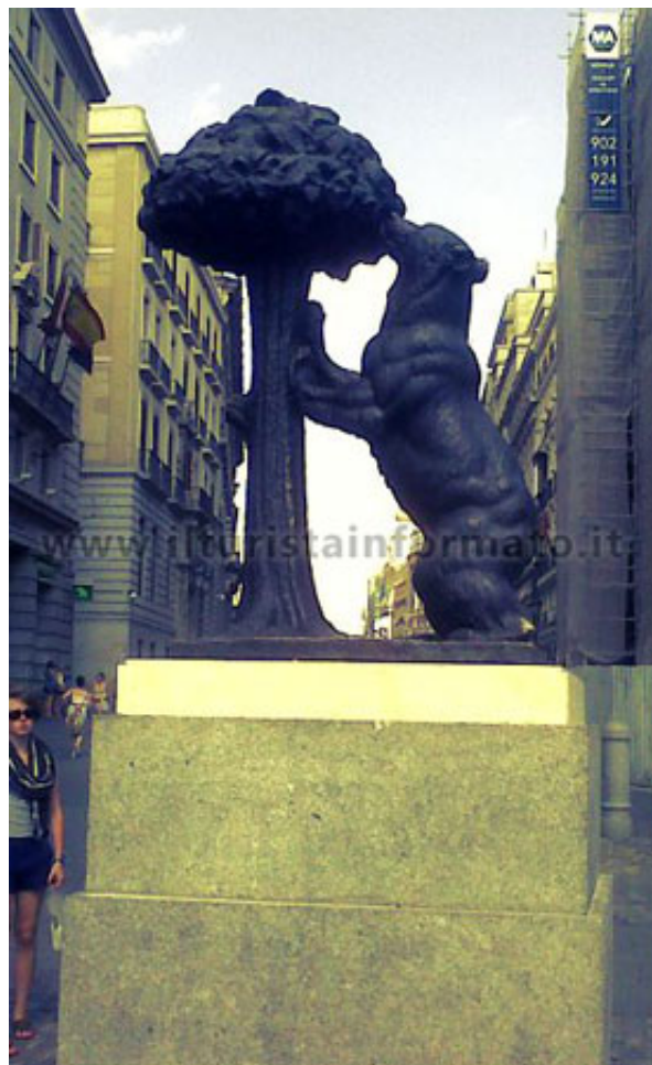
L'orso ed il corbezzolo, simbolo di Madrid