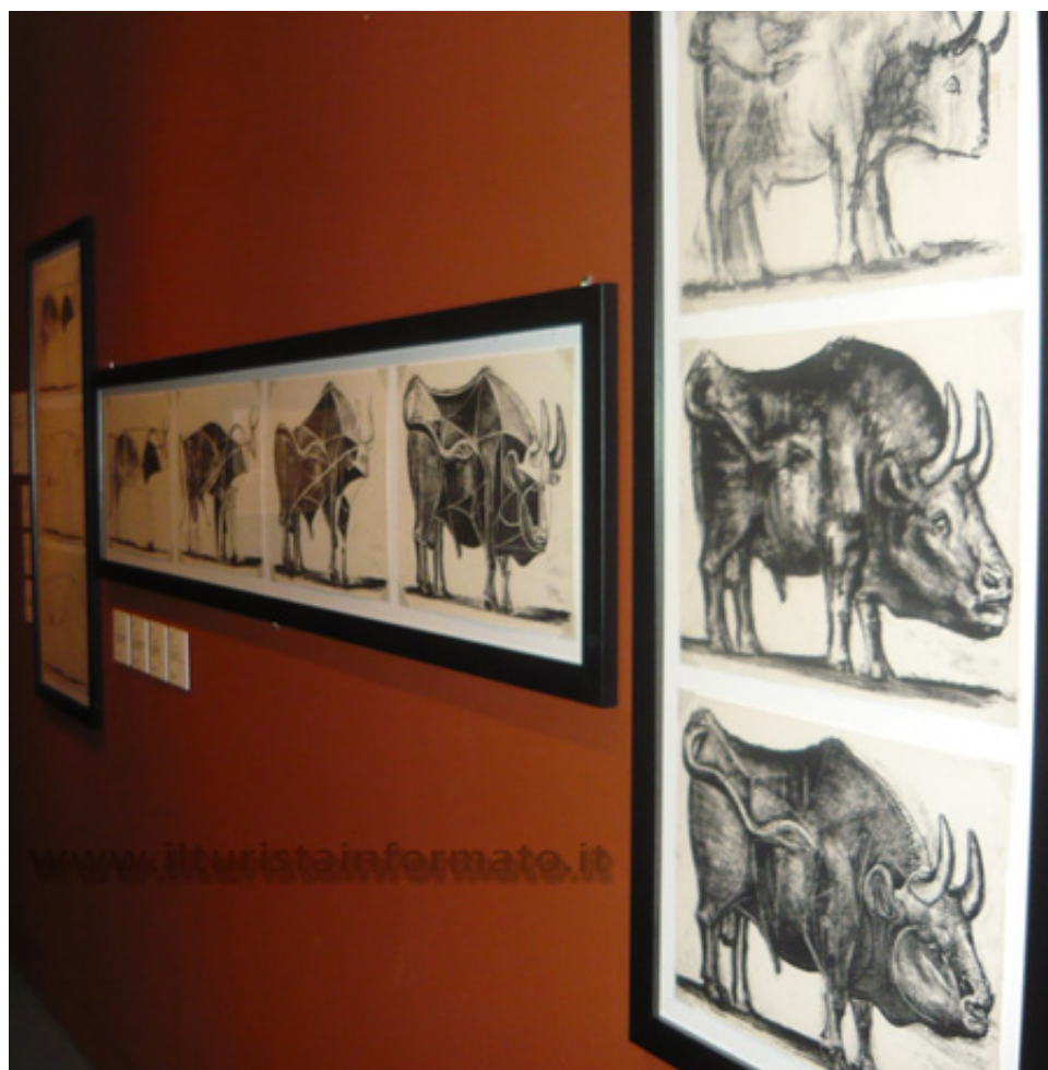
Pablo Picasso Toro - la serie

Quella sintesi artistica, spesso definita come "3 linee che chiunque può fare!", è rappresentata dalla serie del Toro: una potenza unica che ti colpisce con una forza tale da lasciarti senza fiato.