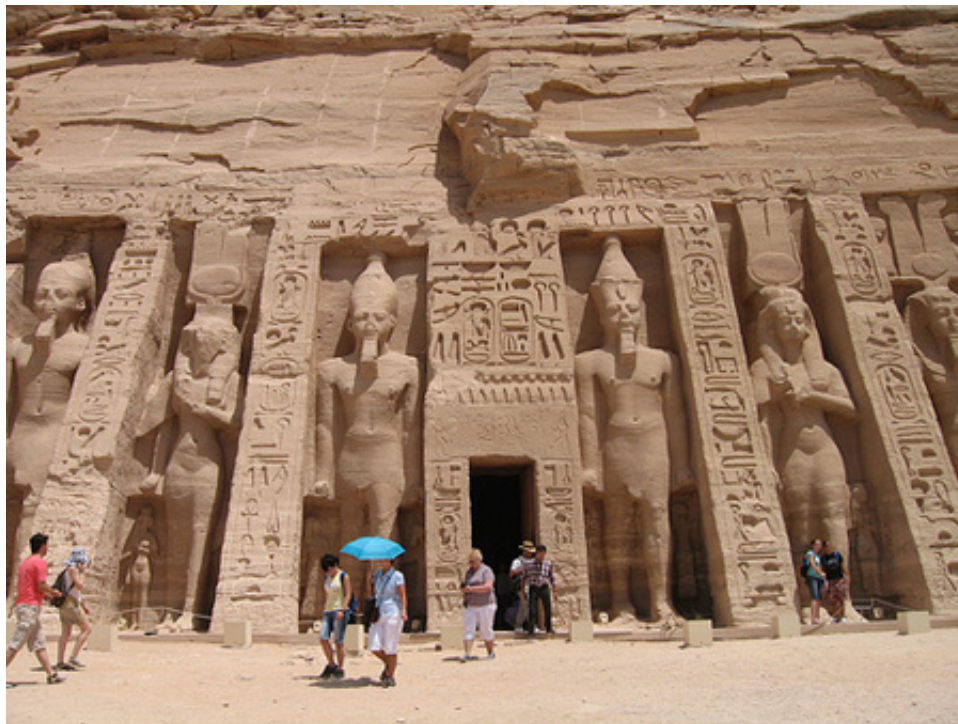
Tempio di Nefertari

Qualsiasi sia la ragione della scelta di queste date, rimane incredibile ad oggi comprendere come gli antichi egizi avessero fatto calcoli così approfonditi e misurato distanze solari con i pochi mezzi che avevano a disposizione.