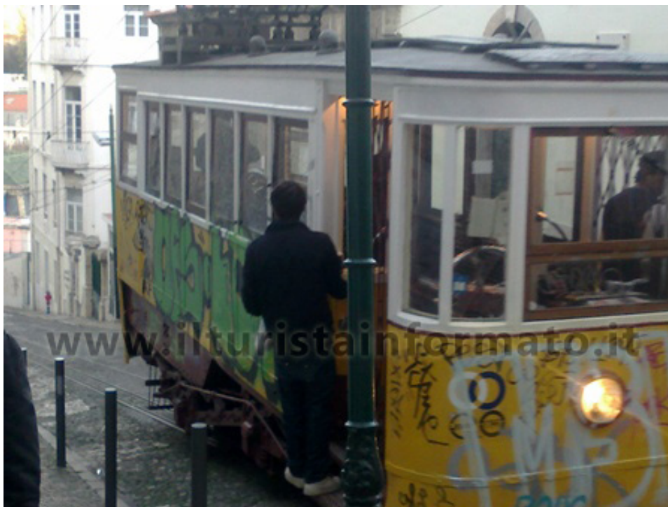
Il tram turistico n. 28 di Lisbona