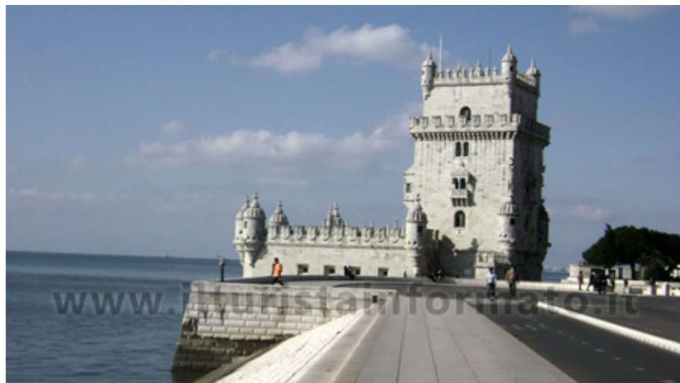
La Torre di Belem di Lisbona