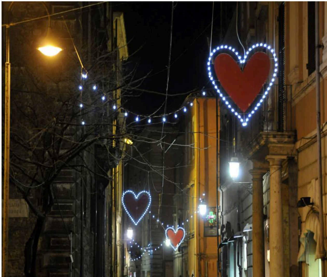
Gli addobbi delle vie del centro

Il claim “La passione è nella nostra natura” è già un programma: i due cuori di cioccolata col cuore rossoverde rappresentano – oltre ai colori della città – alcuni degli invitanti sapori che si potranno gustare negli stand: menta, lime, zenzero, peperoncino, frutti di bosco..